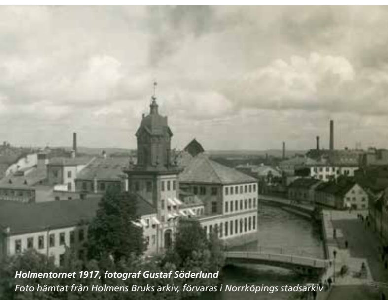
Holmentornet 1917, fotograf Gustaf Söderlund Foto hämtat från Holmens Bruks arkiv, förvaras i Norrköpings stadsarkiv