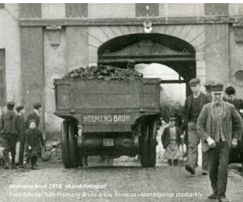
Holmens bruk 1910