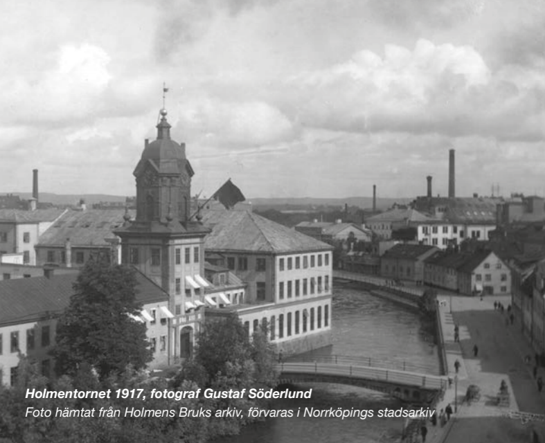
Holmentorget 1917, fotograf Gustaf Söderlund Foto hämtat från Holmens Bruks arkiv, förvaras i Norrköpings stadsarkiv