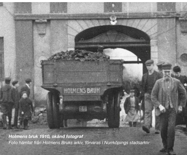
Holmens bruk 1910, okänd fotograf Foto hämtat från Holmens Bruks arkiv, förvaras i Norrköpings stadsarkiv