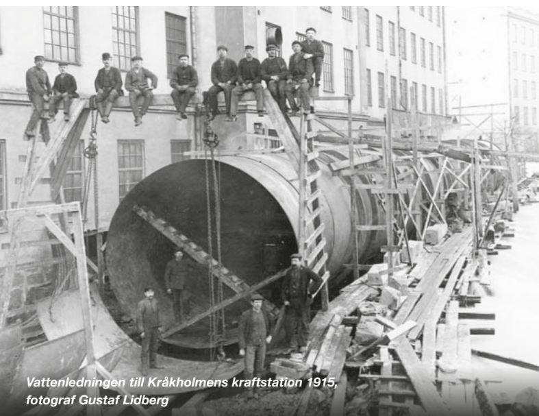
Vattenledningen till Kråkholmens kraftstation 1915